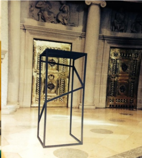
Jürgen Drewer "Minimalistisches Geflecht"