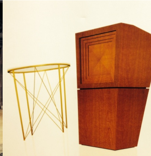
Katharina Sobanski "Liturgische Möbel"