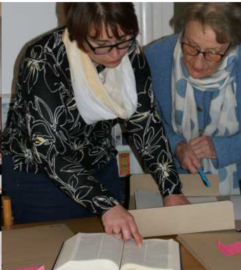
Arbeitsunterweisung für ein Bibelkapitel