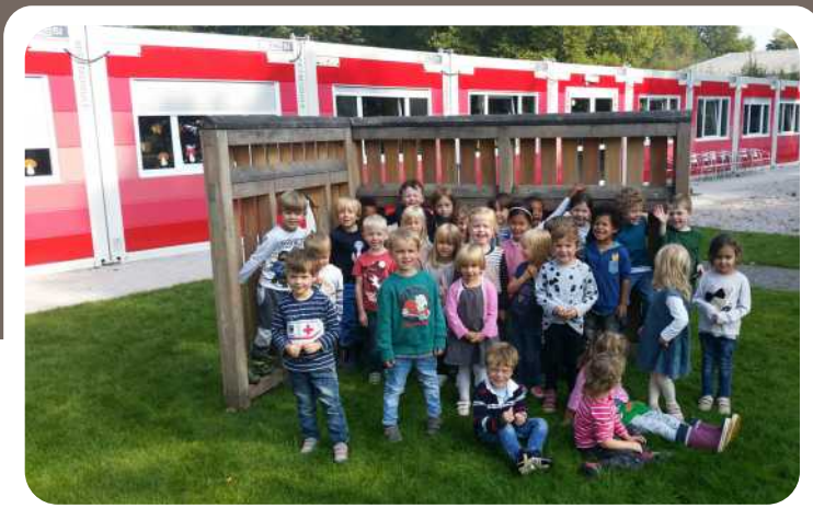
Buntes Ausweichquartier für den Christuskindergarten in unmittelbarer Nähe zum Luisenpark