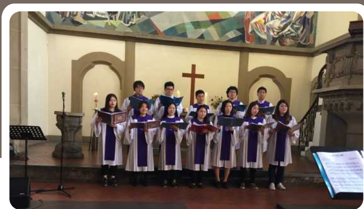
Chor der Evangelisch-koreanischen Agapegemeinde