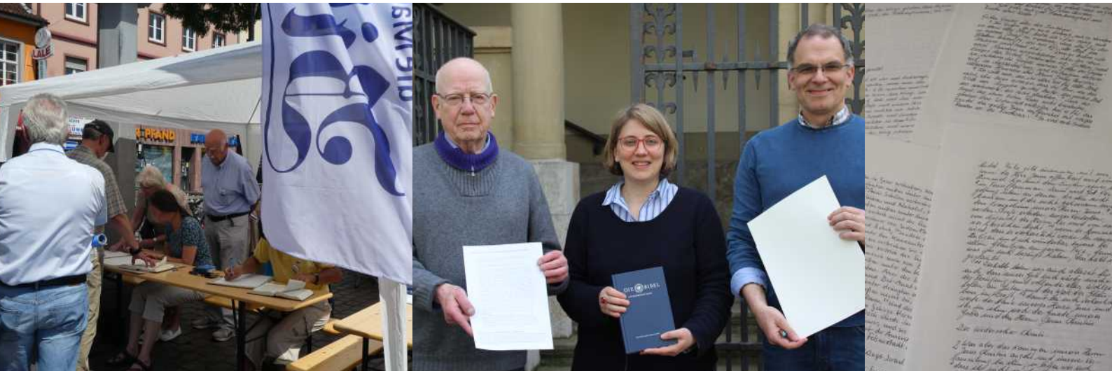
Öffentliches Skriptorium Ökumenischer Kirchen- tag

Oktober 2016: erste Planungen / Januar bis März 2017: Vorbereitungsphase 2. April 2017: Startschuss fürs Abschreiben / Mai bis August: 6 öffentliche Skriptorien / 30. September 2017: Abgabeschluss der fertigen Seiten / Oktober: Schreiben der Inhaltsverzeichnisse, Titelseiten etc., Bindung in 5 Bände / 31. Oktober 2017: Inge- brauchnahme als Altarbibel der Christuskirche Mannheim am 500. Jahrestag der Re- formation