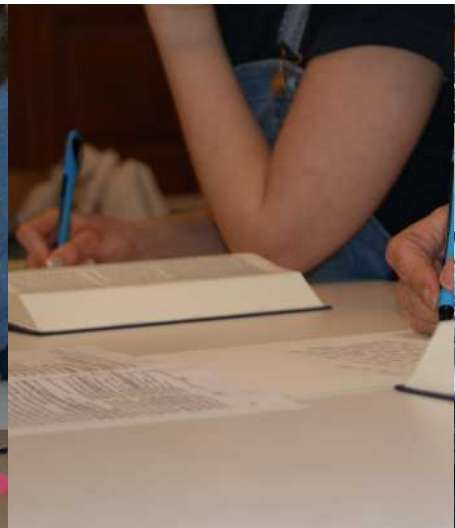
Die ausführliche Anleitung hilft