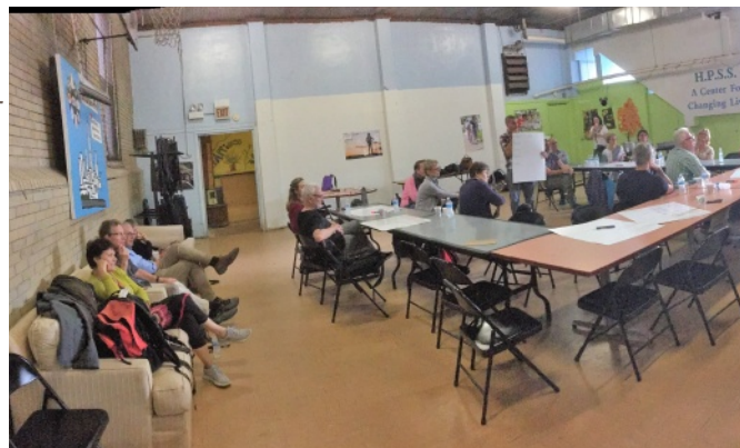
Die Konferenz zu Gast in der West Humboldt Park Lutheran Church, einer Gemeinde lateinamerikanischer Christen.