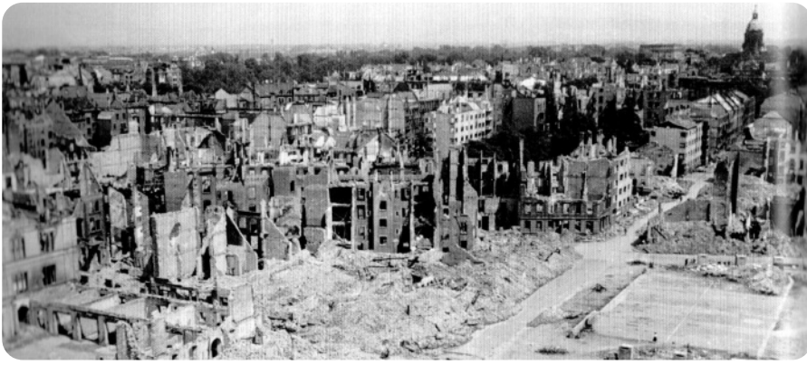
Mannheim 1945 Blick über die Innenstadt Mannheims nach der Zerstörung im 2. Weltkrieg. Rechts im Hintergrund die Christuskirche.