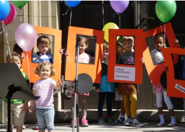
Die Kinder vom Christuskindergarten danken für die großzügige Unterstützung durch die Stiftung

Die dankbare Rückschau auf viel Gutes, das wir in unserer 50jährigen Ehe erfahren durften, führte uns auf den Weg zur Gründung einer kirchlichen Stiftung.