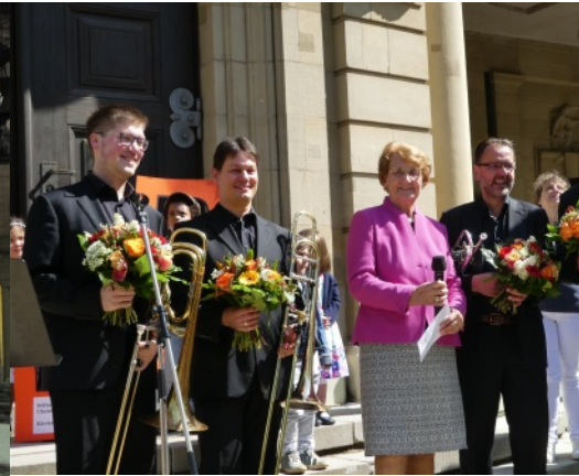
Fröhliche Stimmung beim Stiftungsfest