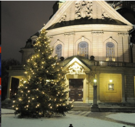
Der Weihnachtsbaum vor der Christuskirche, auch er ein Geschenk der Stiftung