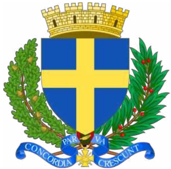
Wappen der Stadt Toulon