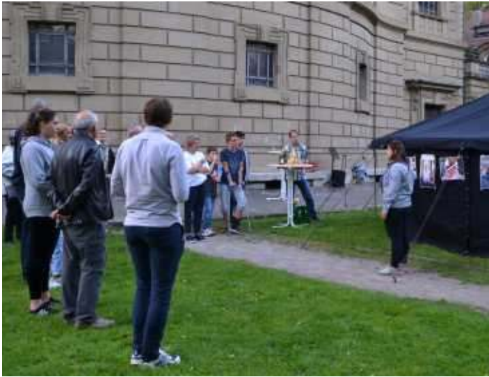
Gründung des Freundeskreises Pfadfinder am 24. September 2021