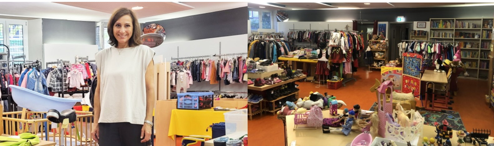
Redaktionsmitglied Tatjana Briamonte-Geiser ist Leiterin des KinderKaufHauses in Mannheim

Im KinderKaufHaus Plus der Diakonie gibt es alles rund ums Kind für den kleinen Geldbeutel