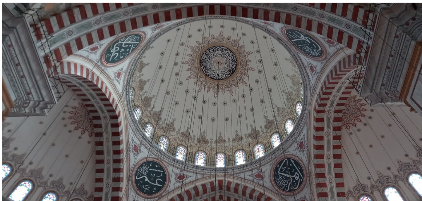
Fatih-Moschee in Istanbul

IB: Liebe Maibritt, für das sehr interessante Gespräch und die ausführlichen Erläuterungen möchte ich Dir ganz herzlich danken.